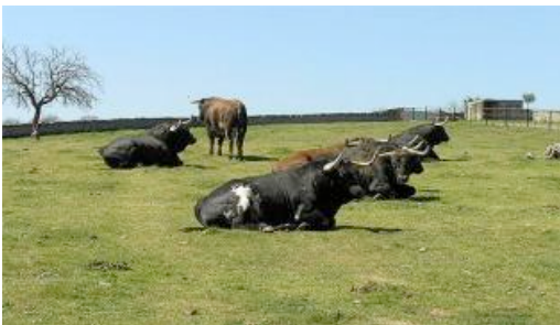
VICTORIANO DEL RÍO